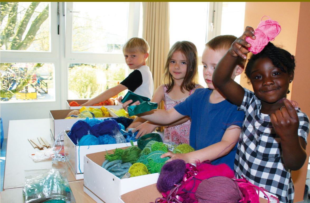
Vorschulkinder aus verschiedenen Kreyenbrücker Kindertagesstätten (hier: St. Johannes an der Pasteurstraße) weben bunte Wimpel, die den Weg zum Festivalgelände weisen.

samer „Stadtteil-Tafel“, die die Vielfalt und das multikulturelle Flair des Stadtteils widerspiegelt. In der Woche vom 15. bis 22. Juni locken verschiedene dezentrale Veranstaltungen. Seinen abschließenden Höhepunkt findet das Programm am 23. und 24. Juni mit vielen Bands, Theatergruppen und Mitmach-Aktionen auf dem Gelände der IGS Kreyenbrück. Mehr zum Farbenfroh-Festival im Innenteil