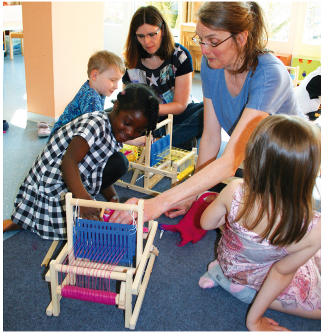
Mit Feuereifer dabei: Kinder aus der Kindertagesstätte St. Johannes weben Wimpel für das Farbenfrohe-Festival.