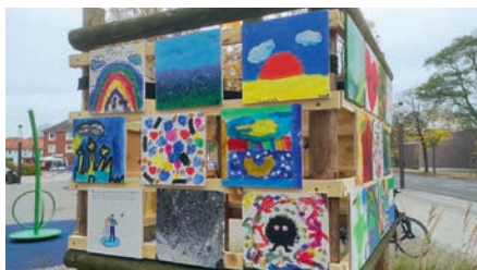
Ein farbenfrohes Ergebnis: Auf dem Klingenbergplatz steht eines der Kunstwerke.