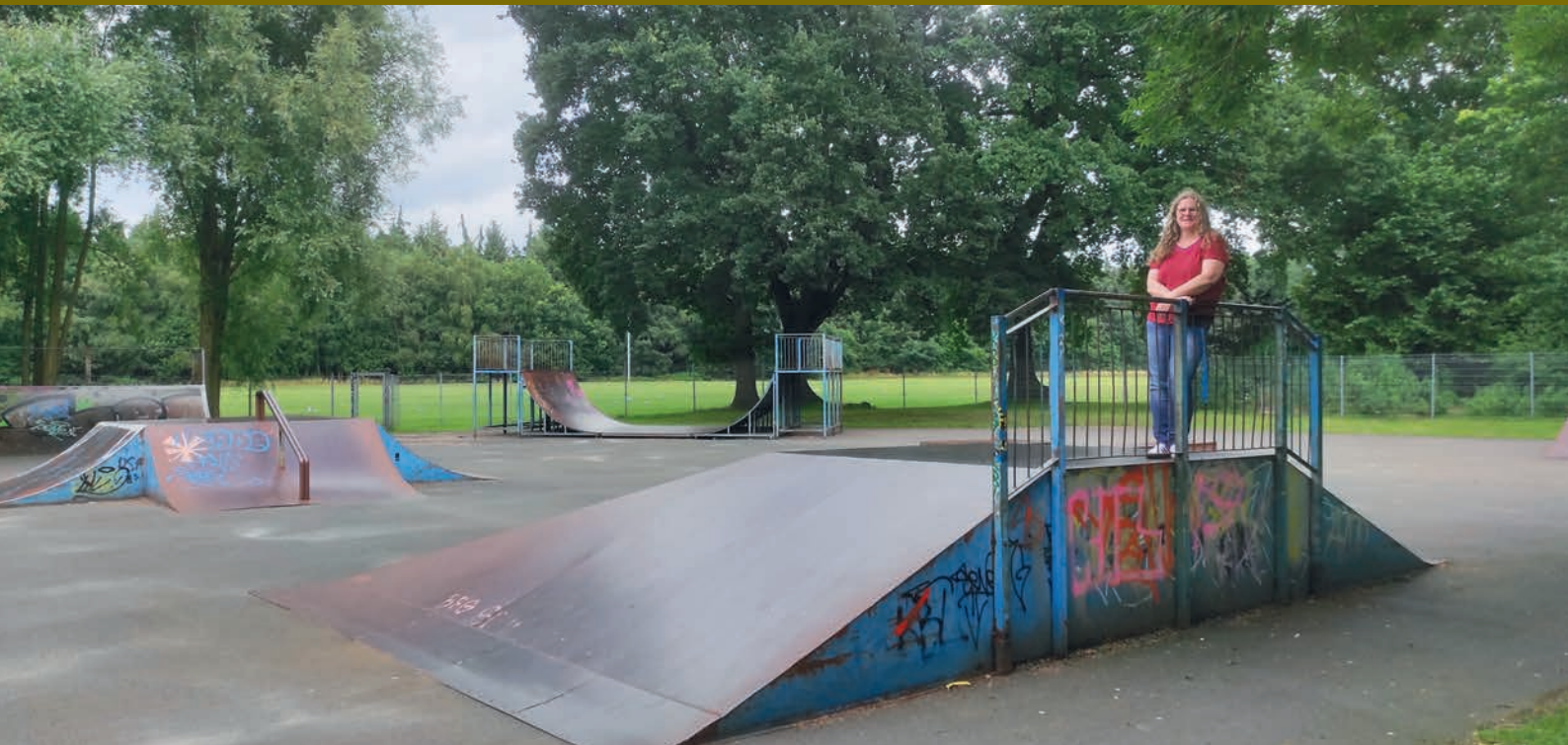
Freut sich auf eine neue Skate-Anlage: Katrin Wiese, Leiterin der Jugendfreizeitstätte „Cafta“.

Angrenzend an die Skate-Anlage entsteht ein Sportpark – unter anderem mit einem Pumptrack für BMX- und Mountainbike-Fahrern. Mehr dazu auf Seite 2 →