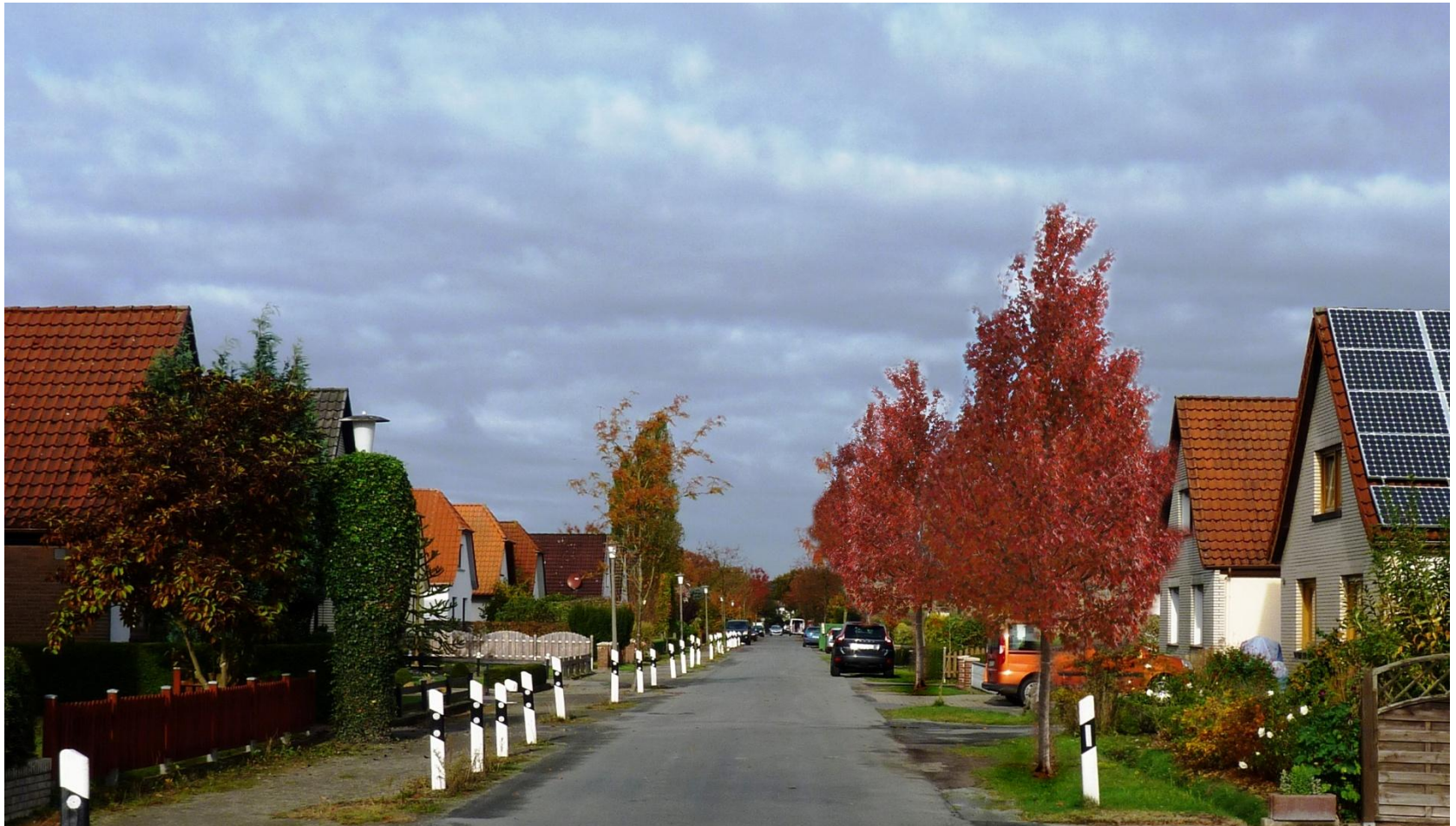
Acer rubrum `Oktober Glory`